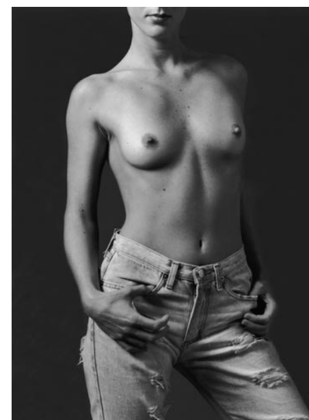
”Paysages de l' Aurore” (bis)