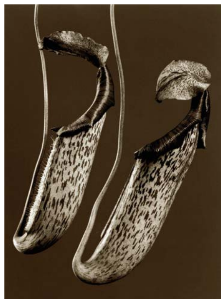
”L' Art et la Nature La Nature de l' Art” (bis)